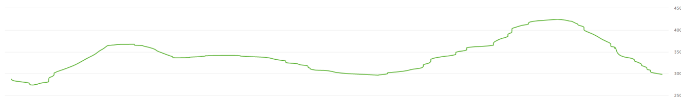
1 Promena uspona na stazi od 5 km